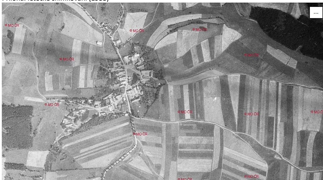
Příloha: letecké snímkování (1938)